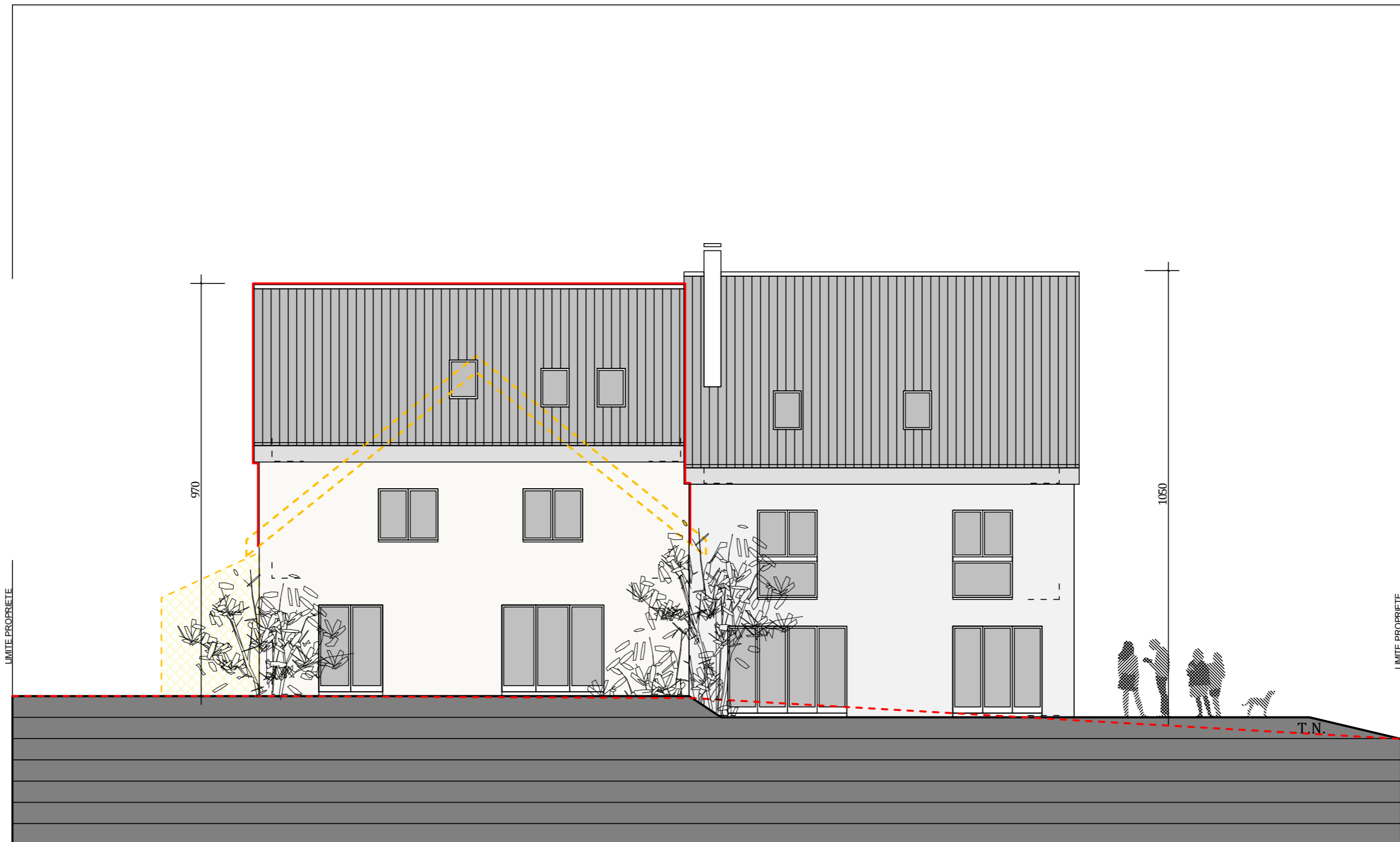
FACADE OUEST - ECH. 1/100