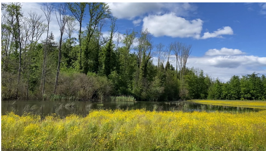
Le nouvel étang aux abords de la forêt des Grand-Bois

Comme déjà relevé dans le rapport de gestion 2024, la famille de castors installée dans la forêt des Grands-Bois poursuit ses travaux d'aménagement du territoire en provoquant l'inondation progressive de terres agricoles situées en lisière de forêt. L'aspect lié à la biodiversité et au rôle écologique du castor a été présenté à la population lors de la journée en forêt organisée le samedi 30 août 2025 . À cette occasion, la Municipalité a invité un représentant de l'association BeaverWatch Suisse afin de proposer une conférence in situ consacrée à ces nouveaux occupants de notre réserve forestière. La Municipalité a également profité de cette rencontre pour sensibiliser les participants aux enjeux liés à la prolifération des plantes invasives sur le territoire communal.