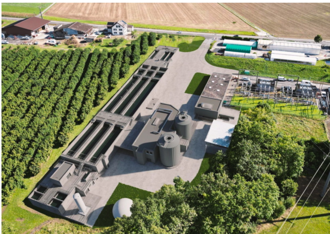
Rendus 3D figurant les nouvelles installations de la STEP de l'ASET

Le Conseil intercommunal de l'ASET a accordé, le 29 janvier 2026, un important crédit d'investissement destiné à la réalisation du projet. Initialement estimé à environ 32,5 millions de francs lors de la création de l'association, le coût global net du projet a depuis été réévalué à près de 47,8 millions de francs. Cette augmentation s'explique principalement par l'évolution du dimensionnement des installations, le renchérissement généralisé des matériaux et équipements depuis la pandémie de COVID-19 et la guerre en Ukraine, le renforcement des exigences techniques et énergétiques, ainsi que par la complexité des infrastructures de raccordement et des ouvrages annexes nécessaires au projet.